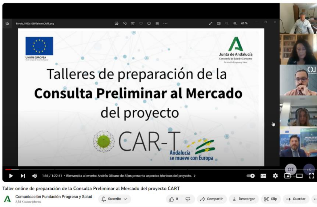
Ilustración 2: Taller Informativo sobre la CPM de CART_ANDALUCIA, 29 de marzo de 2023. 8

Durante la sesión, que contó con la presencia de 21 entidades (ver Anexo III), se profundizó en aspectos técnicos del reto tecnológico planteado y de la participación en las consultas preliminares al mercado y se resolvieron las dudas y cuestiones de las entidades.