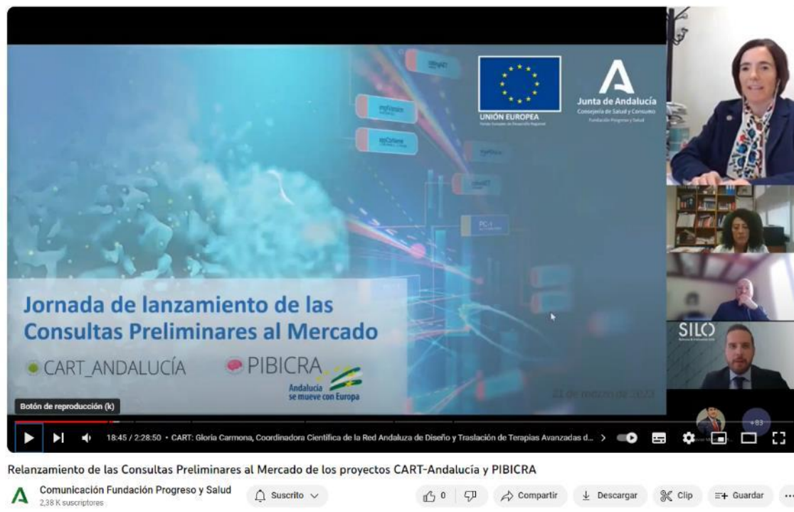
Ilustración 1: Jornada de Presentación CPM CART_ANDALUCIA, 21 de marzo de 2023. 7